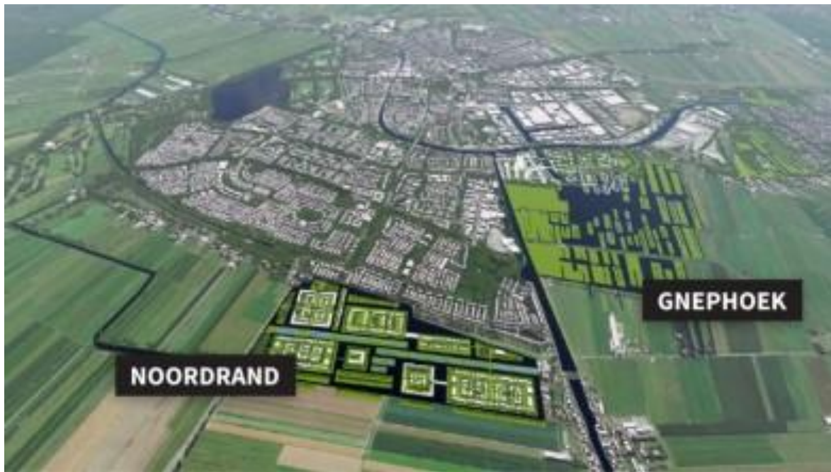
Uit: Perspectief voor landschap en stad