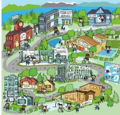
Wonen: leefbaarheid, voorzieningen

Hieronder het overzicht van de thema's waarover we met alle deelnemers van de participatie in gesprek gaan. Deze thema's zijn in de kennismakingsgesprekken met omgevingspartijen geïnventariseerd. Partijen hebben hierbij van te voren kunnen aangeven over welke thema's ze graag willen meepraten en over welke thema's niet. Het overzicht hiervan in te vinden is bijlage 1.