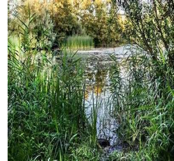
Groen en water: natuur, recreatie, cultuurhistorie